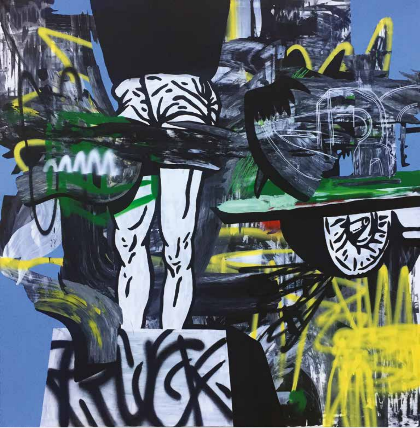
PARK II | PARK II, 2019 Tuval üzerine akrilik ve sprey boya Acrylic and spray paint on canvas 200x200 cm