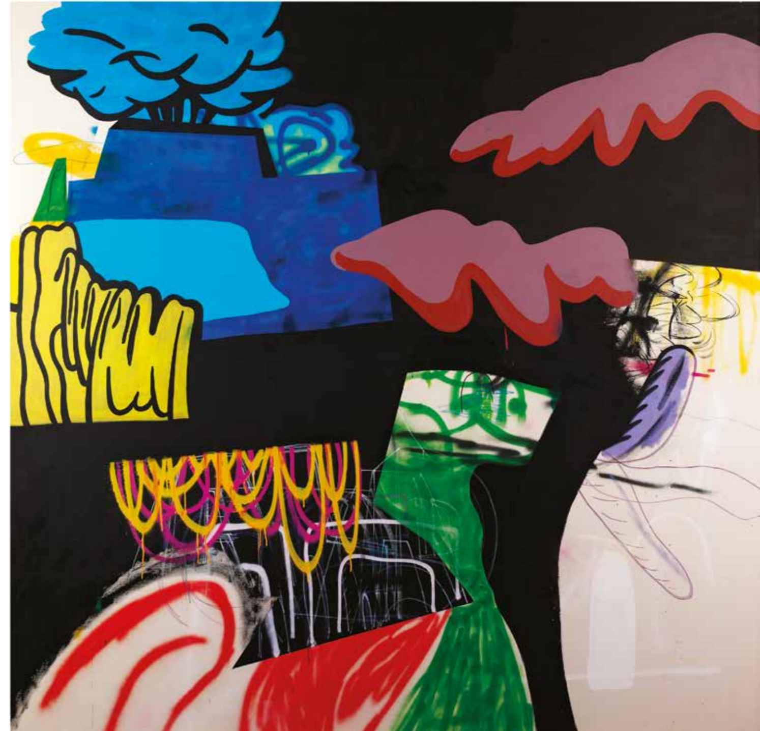
PARK I | PARK I, 2019 Tuval üzerine akrilik ve sprey boya Acrylic and spray paint on canvas 200x200 cm