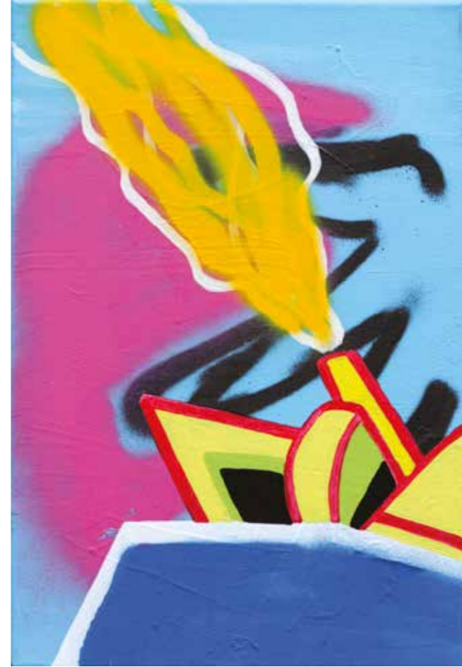
İSİMSİZ | UNTITLED, 2019 Tuval üzerine mürekkep, akrilik ve sprej boya Ink, acrylic and spray paint on canvas 45x30 cm