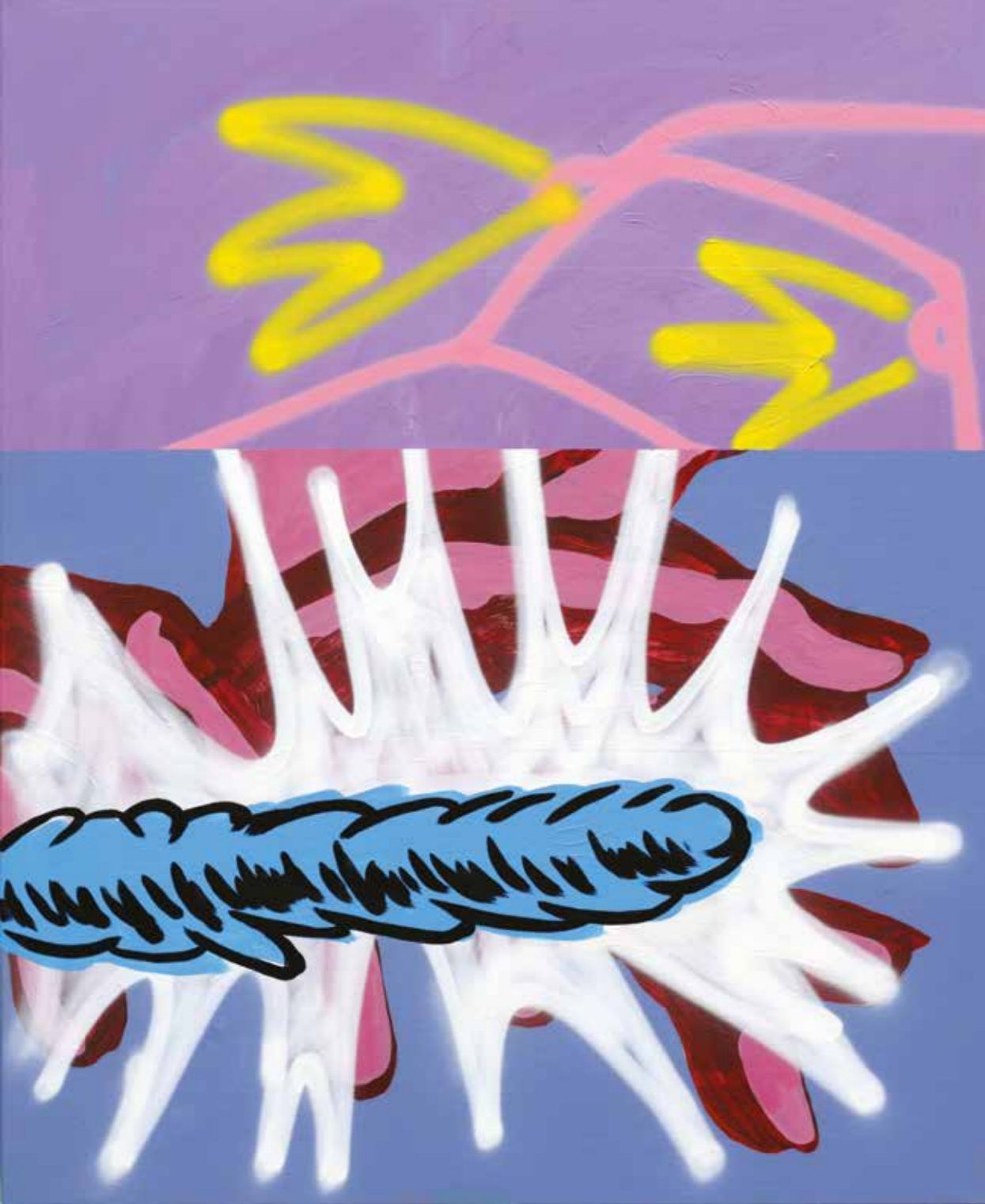
İSİMSİZ | UNTITLED, 2019 Tuval üzerine akrilik ve sprej boya Acrylic and spray paint on canvas 110x90 cm