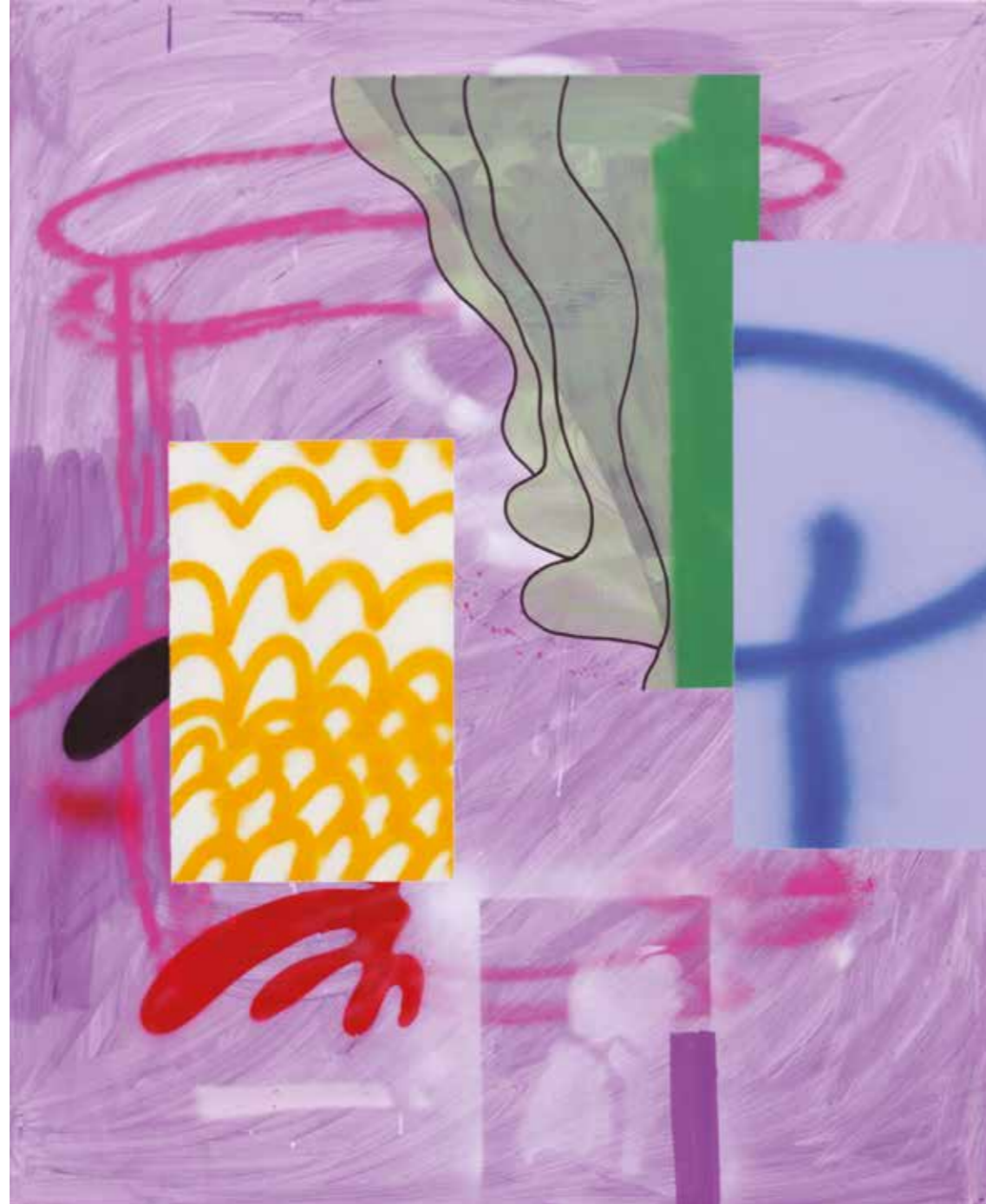
İSİMSİZ | UNTITLED, 2019 Tuval üzerine mürekkep, akrilik ve sprej boya Ink, acrylic and spray paint on canvas 110x90 cm