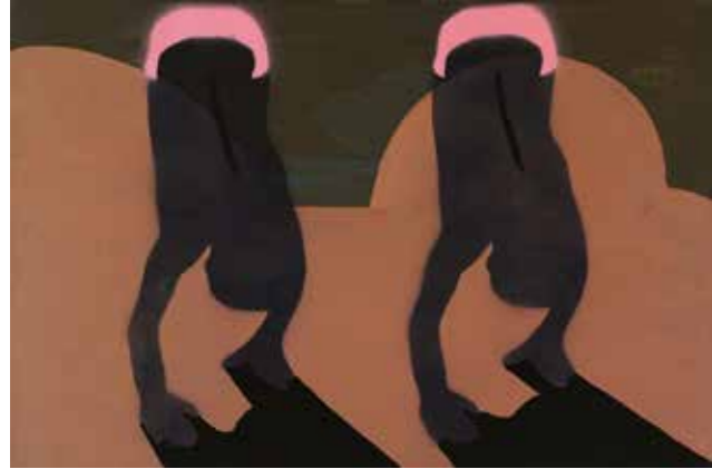
İsimsiz | UNTITLED, 2019 Tuval üzerine mürekkep, akrilik ve sprej boya Ink, acrylic and spray paint on canvas 30x45 cm