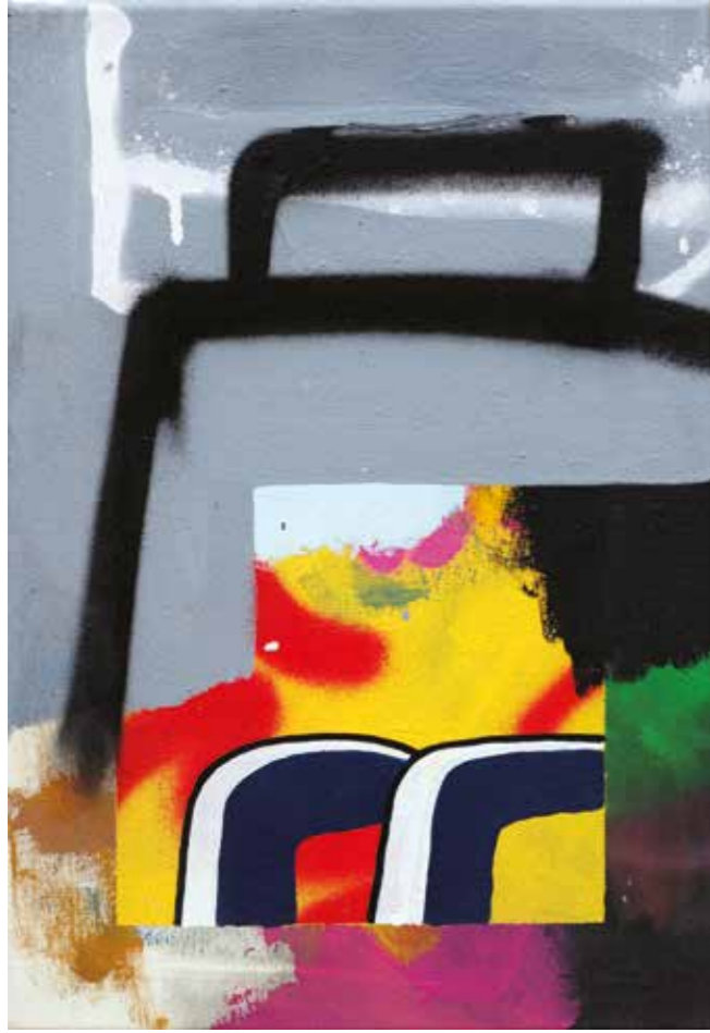
İSİMSİZ | UNTITLED, 2019 Tuval üzerine mürekkep, akrilik ve sprej boya Ink, acrylic and spray paint on canvas 45x30 cm