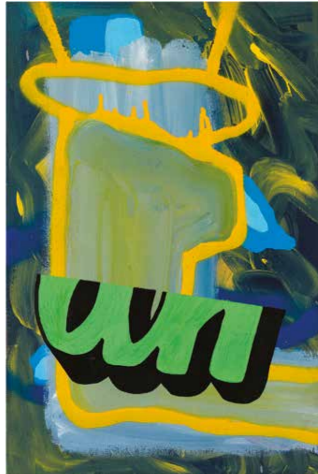
İSİMSİZ | UNTITLED, 2019 Tuval üzerine mürekkep, akrilik ve sprej boya Ink, acrylic and spray paint on canvas 45x30 cm