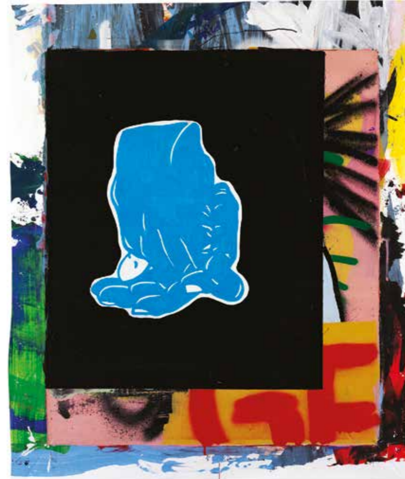
İSİMSİZ | UNTITLED, 2019 Tuval üzerine mürekkep, akrilik ve sprej boya Ink, acrylic and spray paint on canvas 73x61 cm