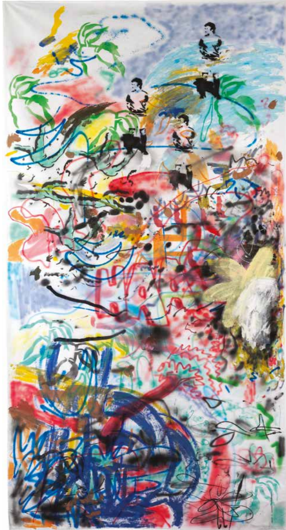
İsimsiz | UNTITLED, 2019 Kumaş üzerine mürekkep, akrilik ve sprey boya Ink, acrylic and spray paint on fabric 230x120 cm

Bu katalog, 07.11-05.12.2020 tarihleri arasında Art On İstanbul'da gerçekleşen Yürüye Yürüye sergisi için hazırlanmıştır.