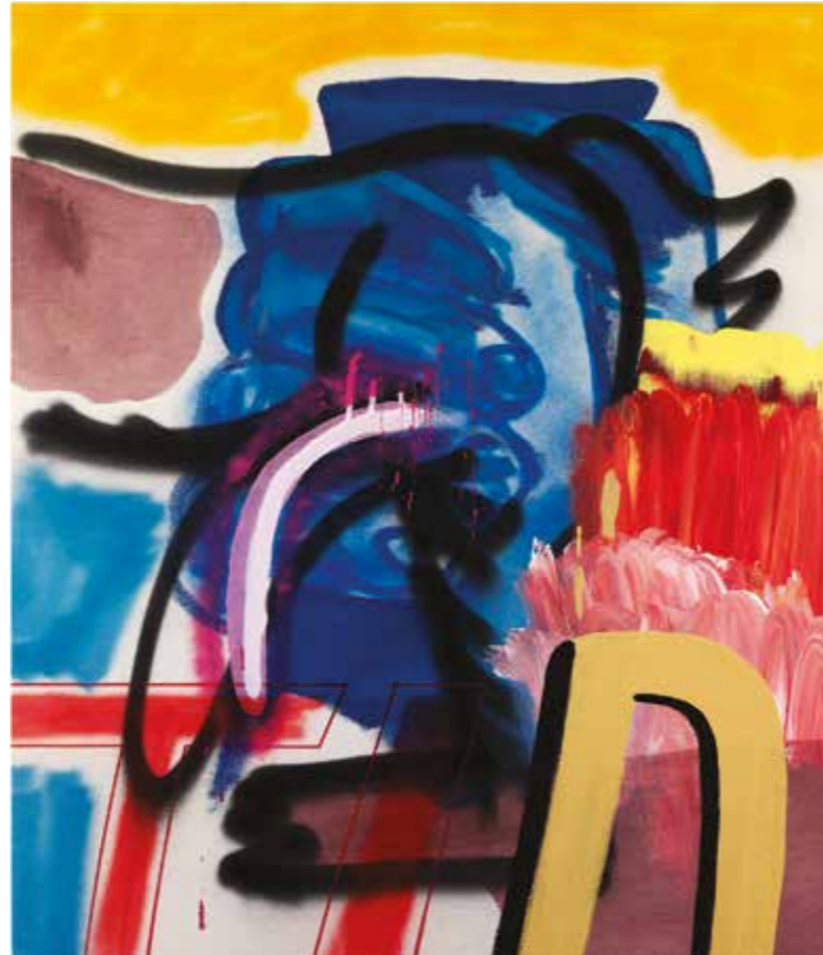
İsimsiz | UNTITLED, 2019 Tuval üzerine mürekkep, akrilik ve sprej boya Ink, acrylic and spray paint on canvas 90x75 cm