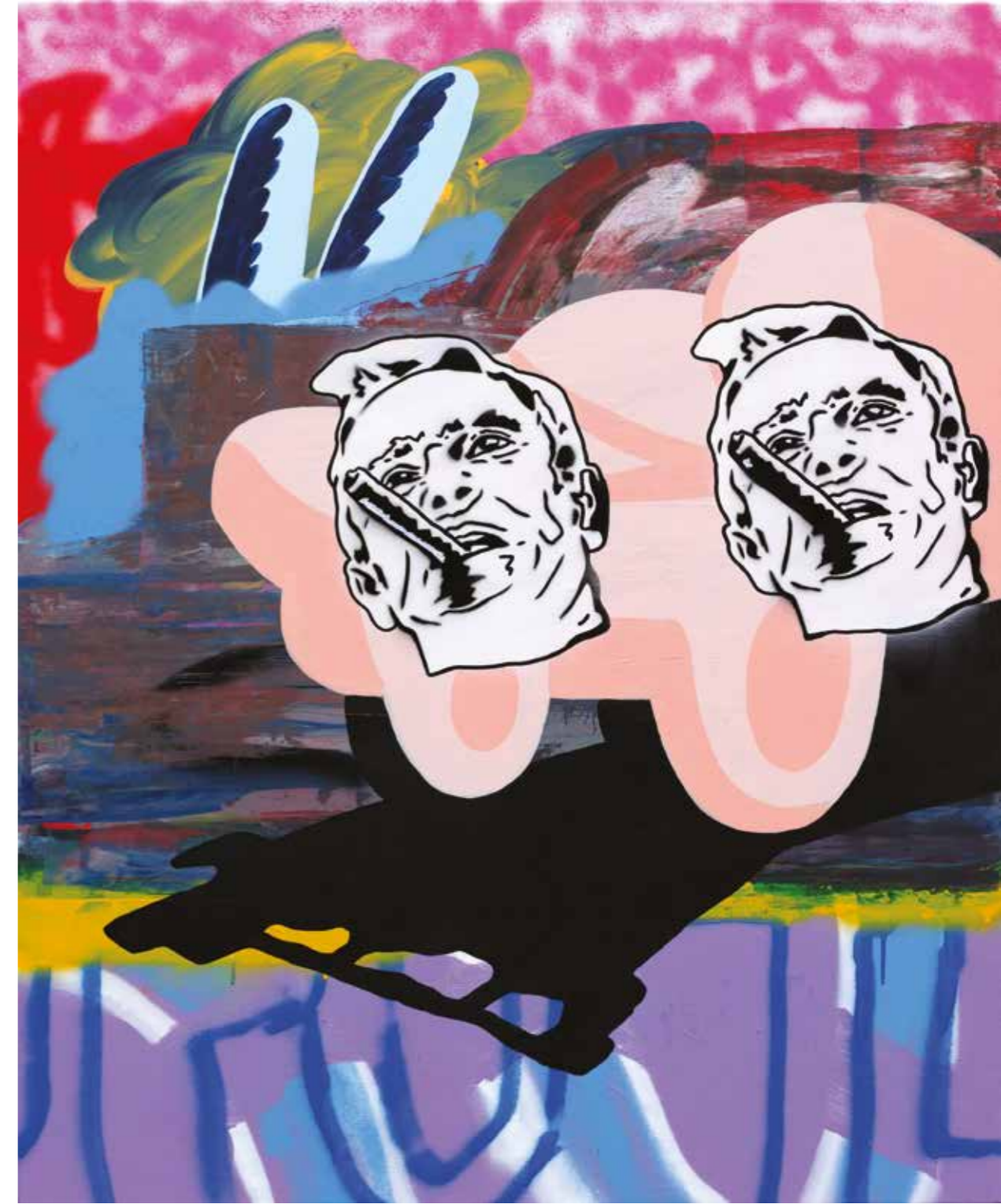
İSİMSİZ | UNTITLED, 2019 Tuval üzerine akrilik ve sprej boya Acrylic and spray paint on canvas 110x90 cm