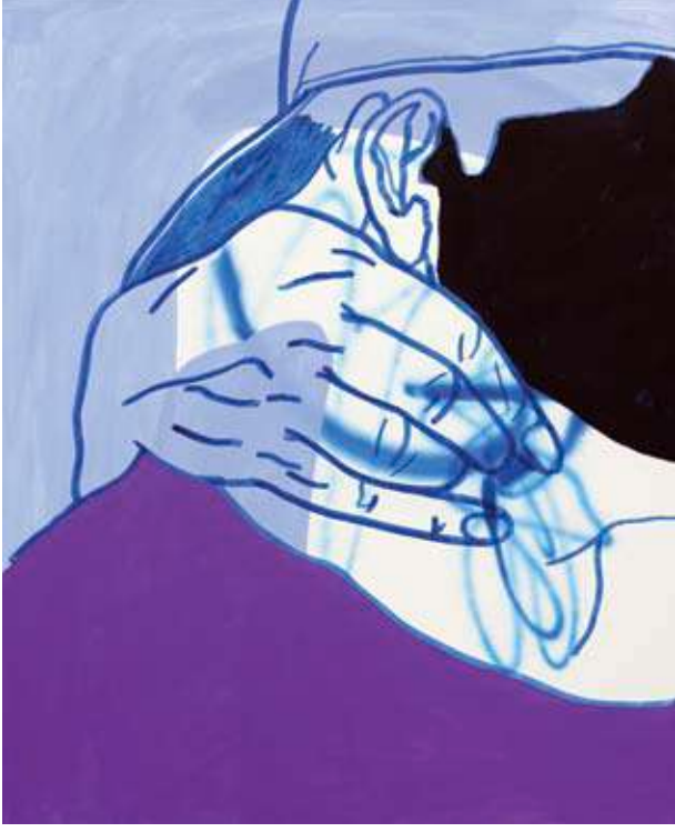
Kanvas üzerine karışık teknik, 110x90, 2019

geçen insanları izleyerek yeni moda fikirleri ediniyorsunuz. Berlin bu konuda çok zengin bir şehir ve vintage kıyafetler hâlâ çok popüler diyebilirim. Bunun sebebi, buradaki insanların,