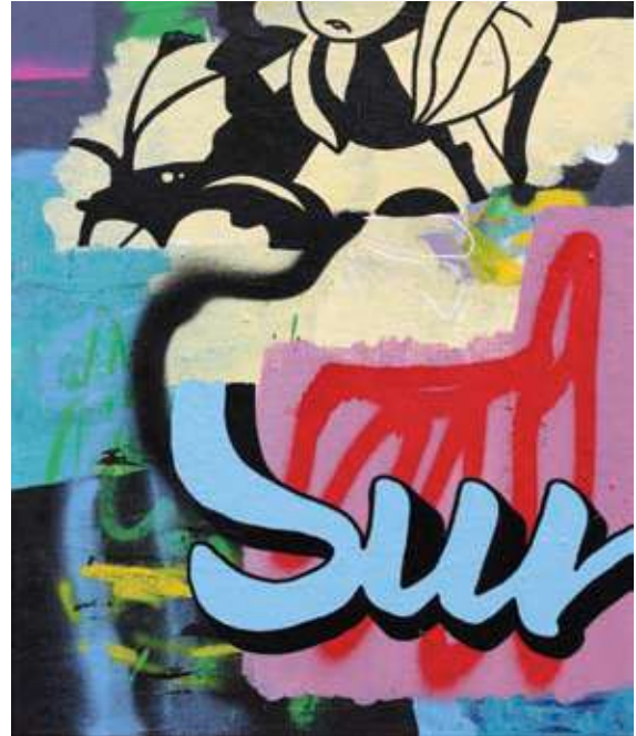
Kanvas üzerine karışık teknik, 60x50, 2019

Açıkçası Berlin’e gelene kadar, resimlerimde kullandığım canlı renklerin aksine, kıyafetlerimde hep pastel ve gri tonları tercih etmişim. Burada resimlerim gibi moda zevkimin de biraz değiştiğini söyleyebilirim. Belki de Berlin havasının yılın büyük kısmında gri olması, beni daha renkli kıyafetler seçmeye yönlendirmiş olabilir. Gün içinde bir cafe’de oturup kahvenizi içerken, sokaktan