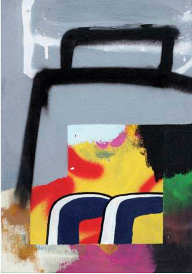
Kanvas üzerine karışık teknik, 45x30cm, 2019

ların farklılığı, kışları gri olması, farklı dil ve kültürlerin bir arada olması ister istemez sizi etkileyen unsurlardan bazıları.