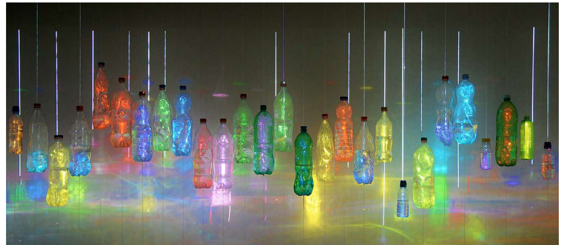
Tajo, 18 m. Installation, Water, 180 used plastic bottles, 180 iron weights, fishing line, 180 iron plaques, projectors, multimedia players, USBs, 3:30 min. video projection loop. Shot at Borusan Contemporary, Istanbul, 2011