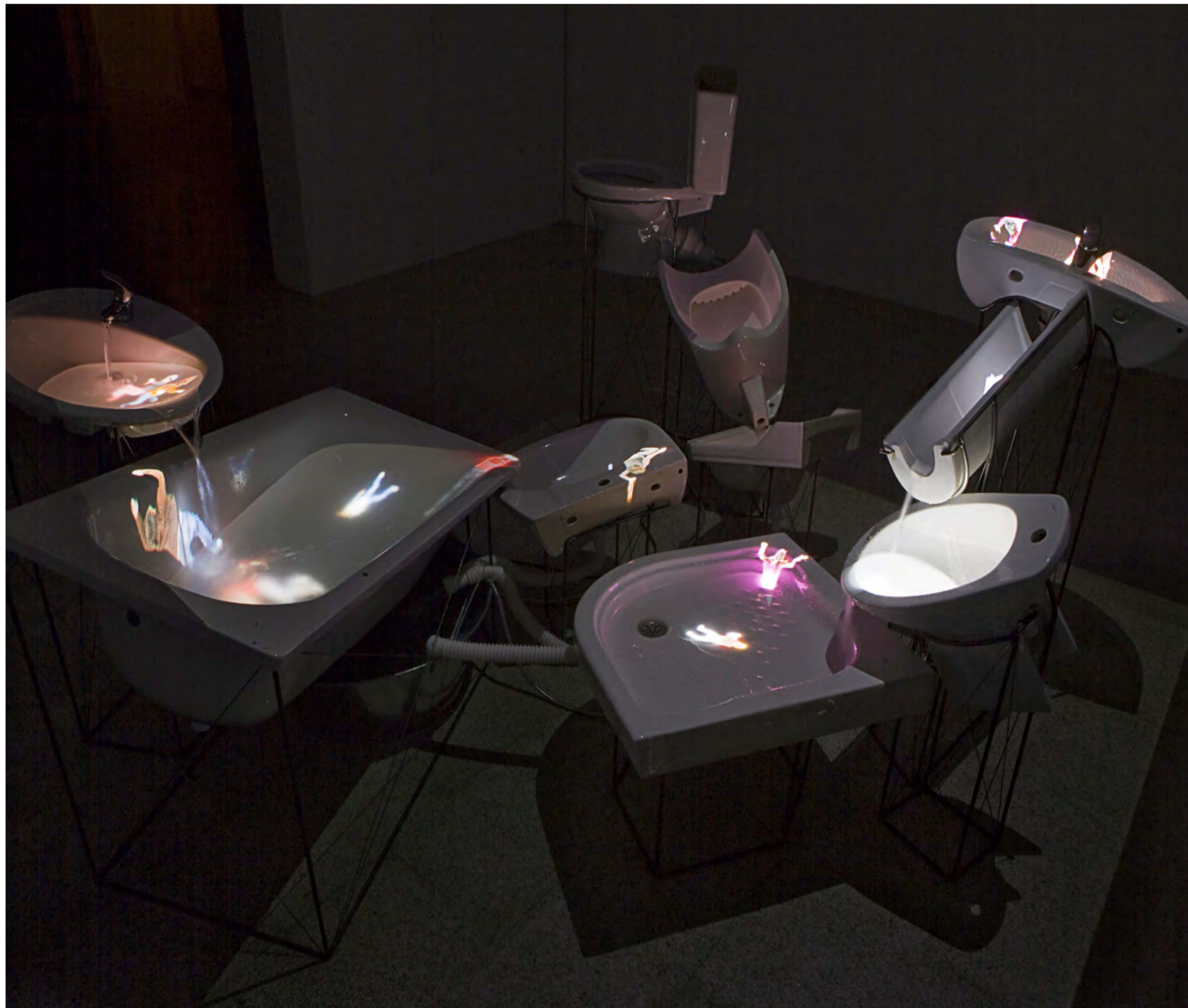
Flow, 152 x 300 x 400 cm. Installation, water, 9 used pieces of sanitary equipment, re-used plumbing equipment, water pump, metal support structures, projectors, multimedia players, USB, 3 min. video projection loop. Shot at Fundación Canal, Madrid, 2011