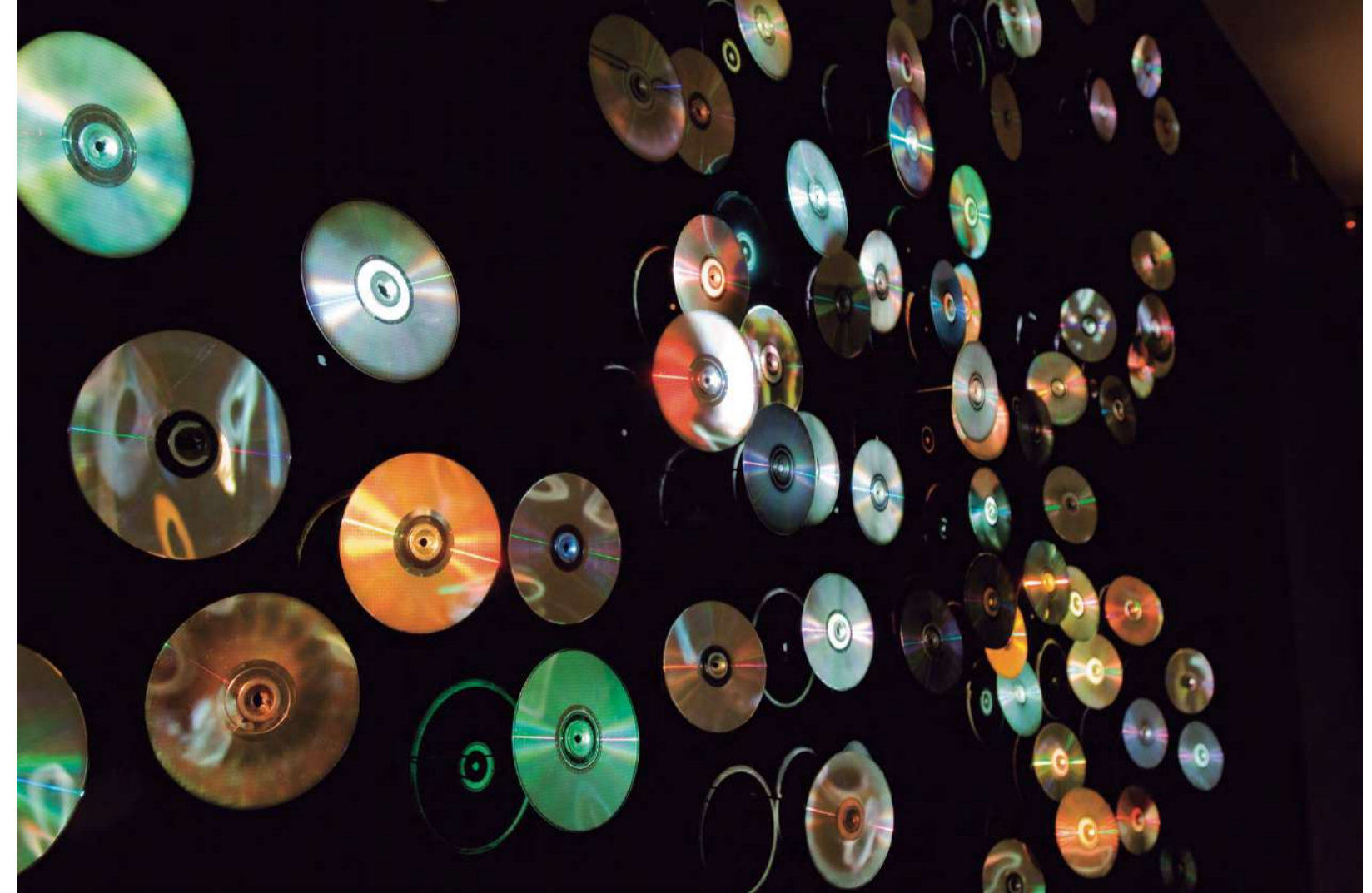
Spin, 100 DVDs, video projector, speakers, multimedia hard disk, 3:30' minute video loop. Installation dimensions variable. Ed.1/3, 2010