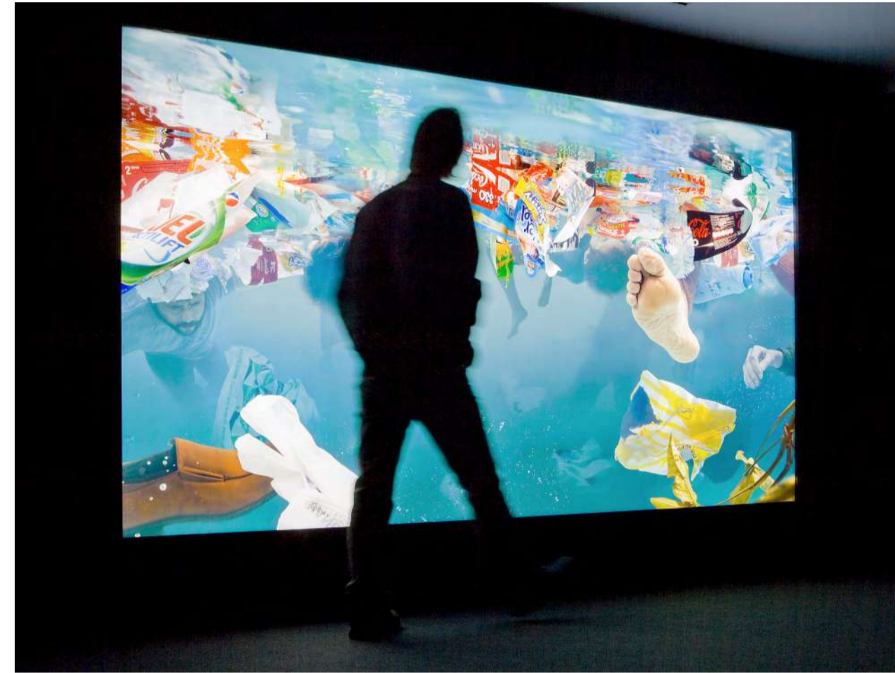
Tide, 180 x 300 cm. Digital Print, Light box, duratrans Infinity printed with Lambda. Shot at Fundación Canal, Madrid, 2011