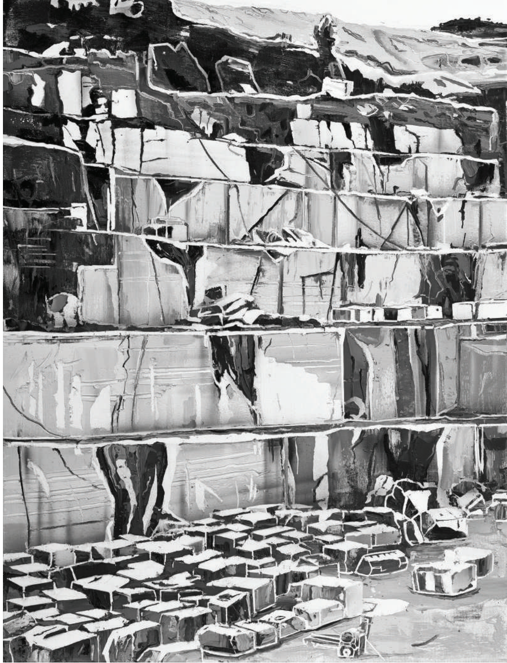
İsimsiz / Untitled 2014 Tuval üzerine yağlı boya / Oil on canvas 85 x 65 cm