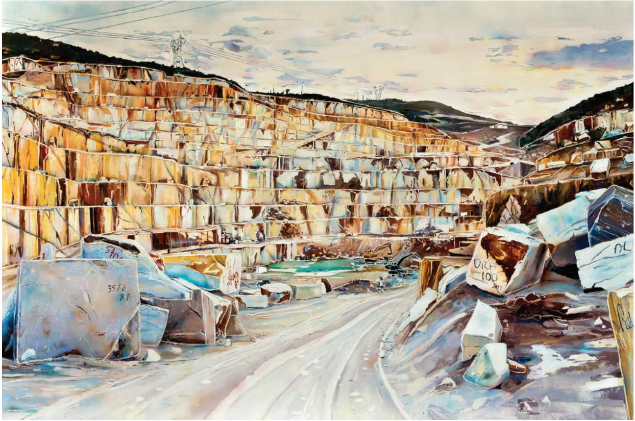
İsimsiz / Untitled 2013 Tuval üzerine yağlı boya / Oil on canvas 180 x 270 cm