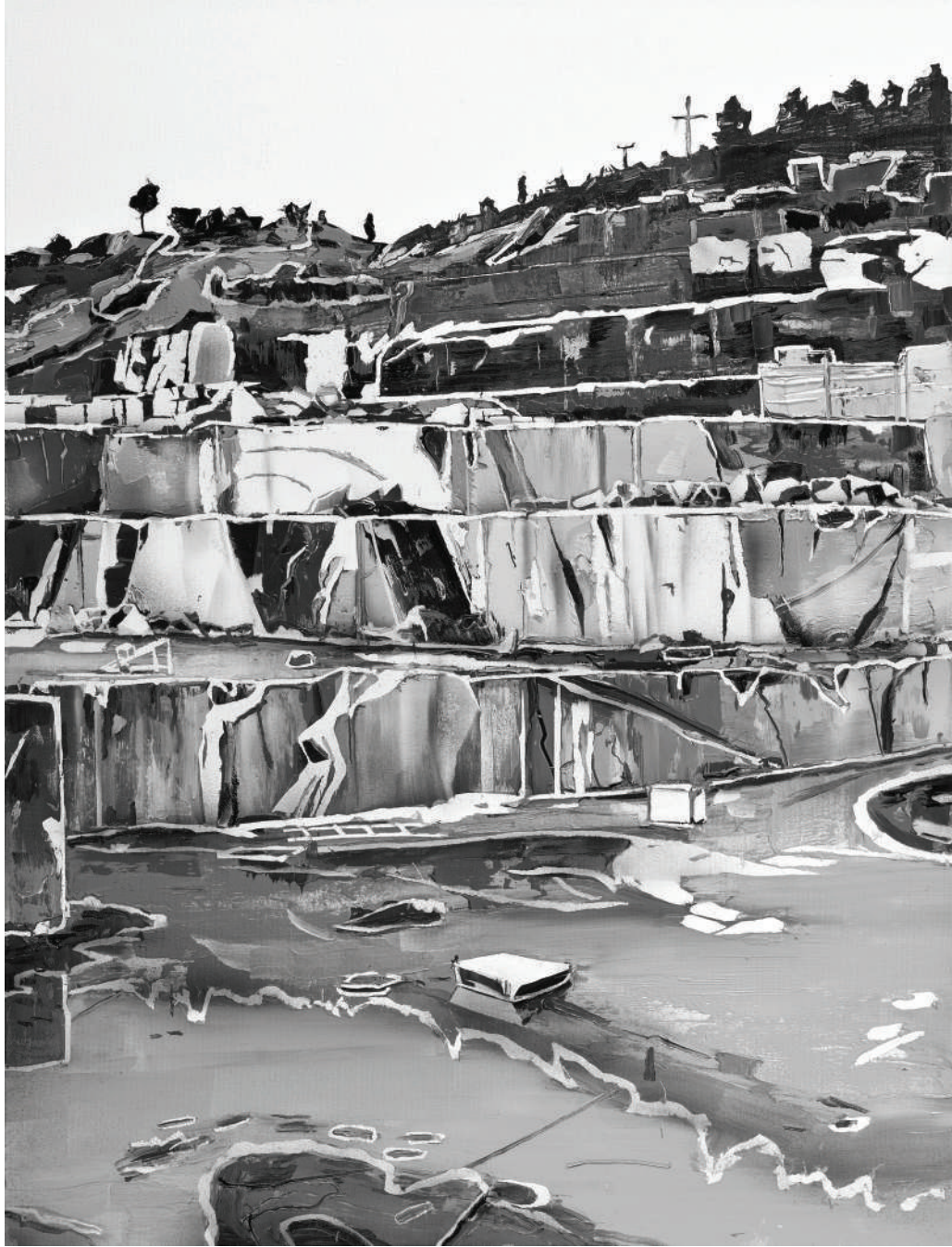
İsimsiz / Untitled 2014 Tuval üzerine yağlı boya / Oil on canvas 85 x 65 cm