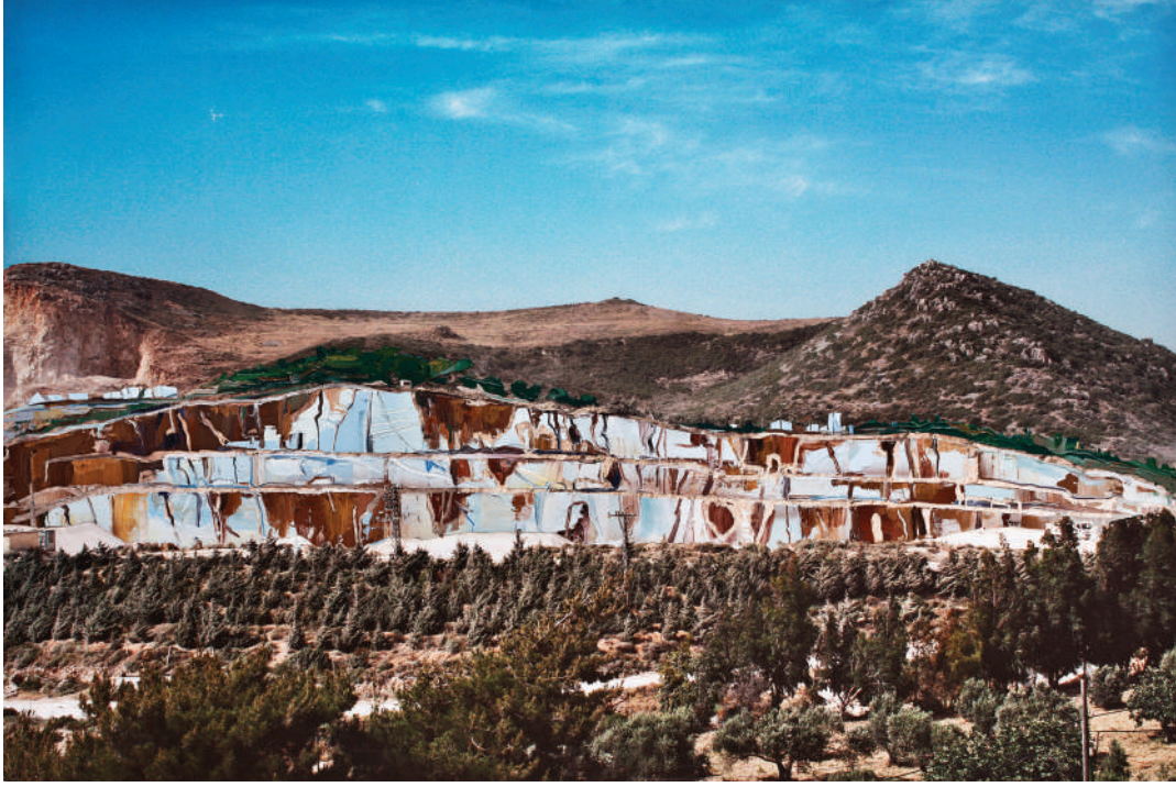
İsimsiz / Untitled 2014 Fotoğraf üzerine yağlı boya / Oil on photography 66 x 100 cm