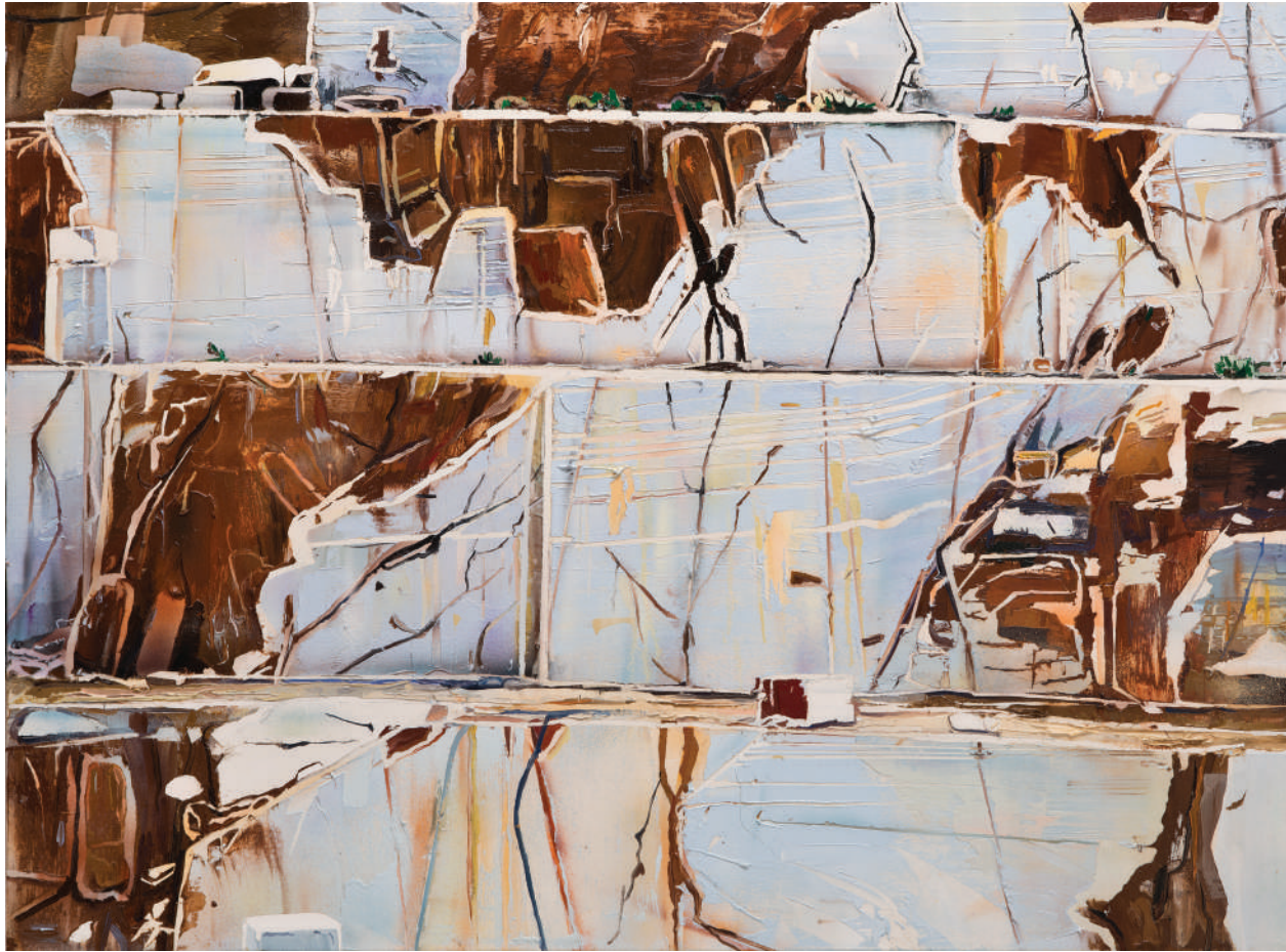
İsimsiz / Untitled 2014 Tuval üzerine yağlı boya / Oil on canvas 85 x 115 cm