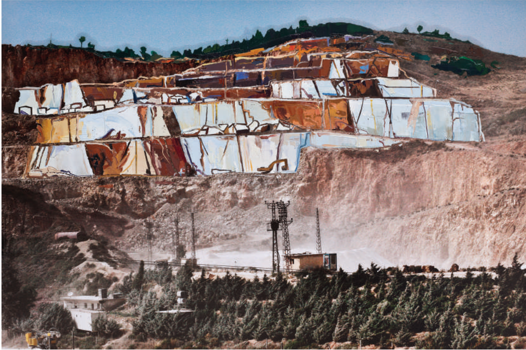
İsimsiz / Untitled 2014 Fotoğraf üzerine yağlı boya / Oil on photography 66 x 100 cm