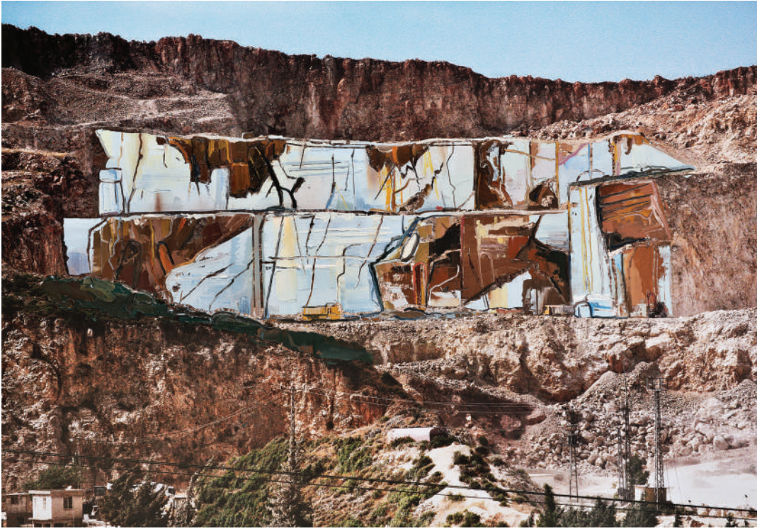
İsimsiz / Untitled 2014 Fotoğraf üzerine yağlı boya / Oil on photography 66 x 100 cm