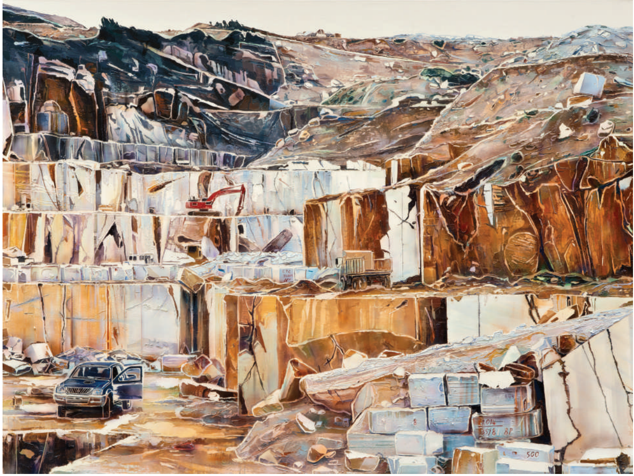
İsimsiz / Untitled 2014 Tuval üzerine yağlı boya / Oil on canvas 180 x 240 cm