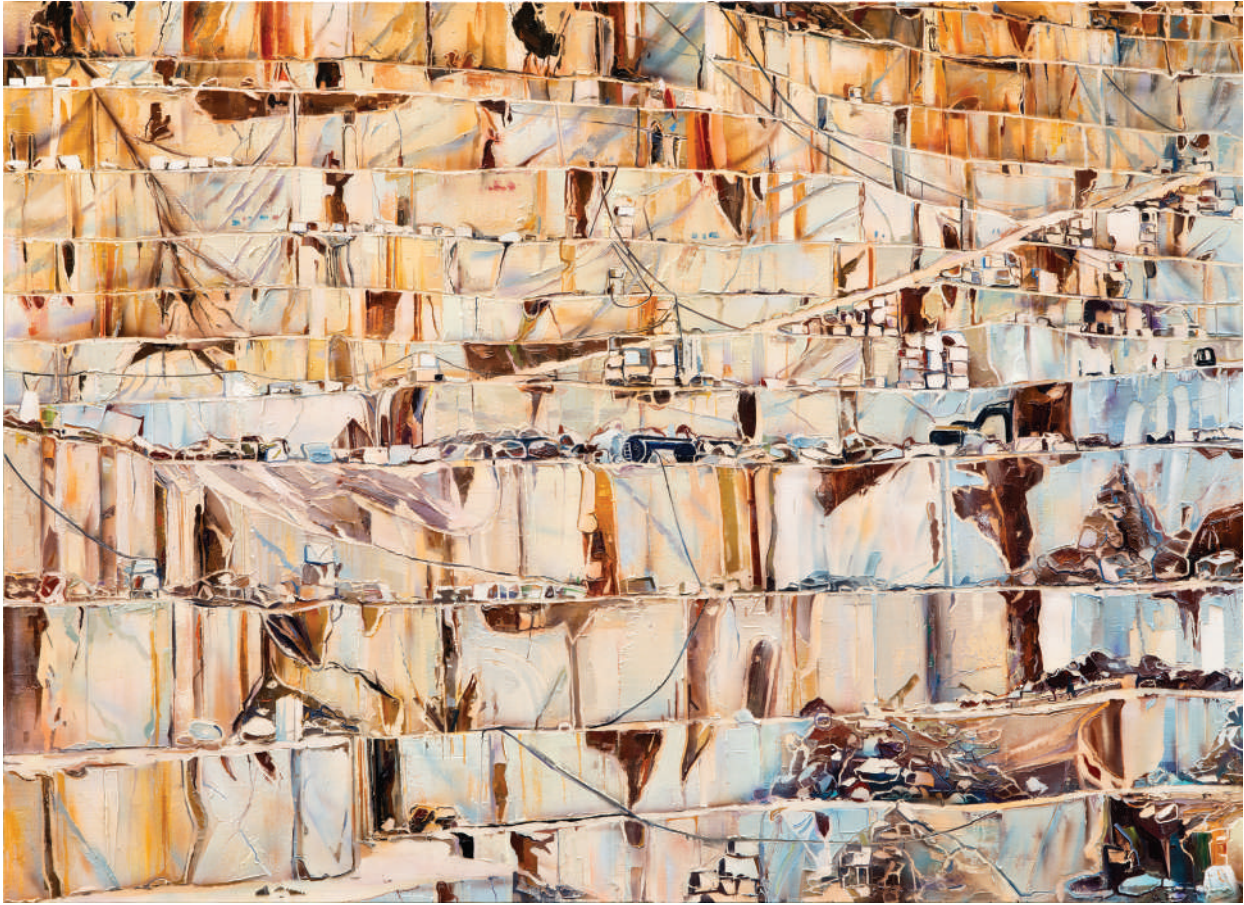
İsimsiz / Untitled 2014 Tuval üzerine yağlı boya / Oil on canvas 160 x 220 cm