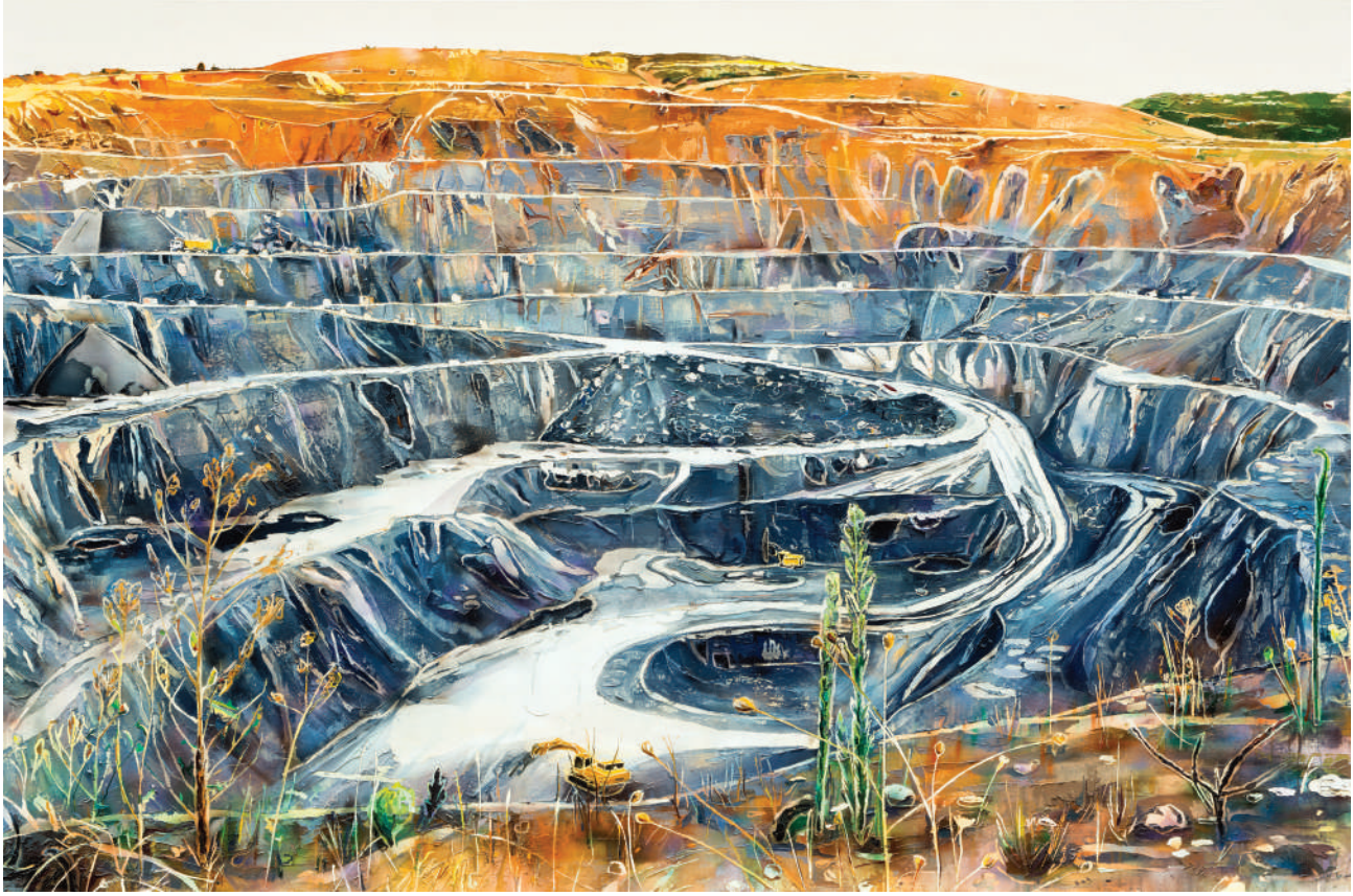
İsimsiz / Untitled 2013 Tuval üzerine yağlı boya / Oil on canvas 180 x 270 cm