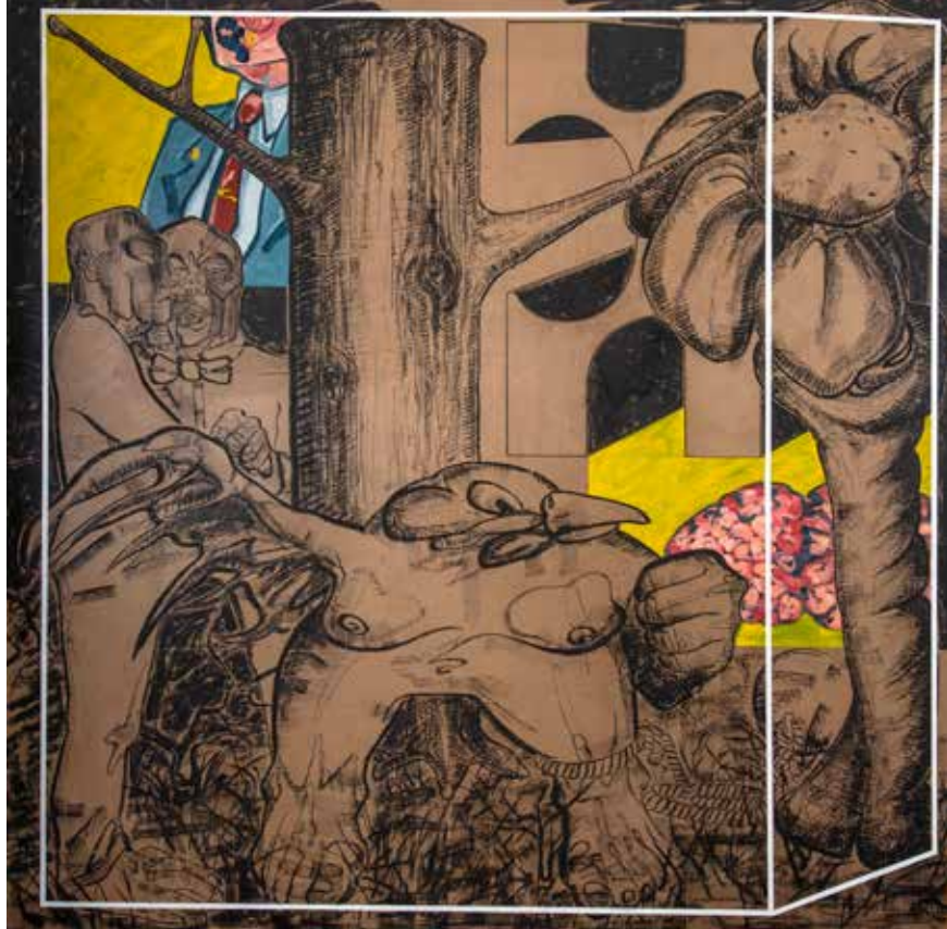
İsimsiz | Untitled 2017

Salı Cumartesi 10.00-19.00 Tuesday-Saturday 10 am-7 pm