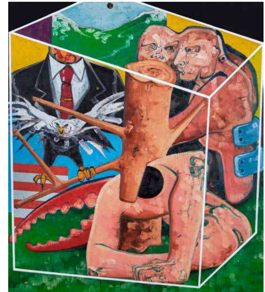
Isimsiz | Untitled 2017 Tuval üzerine yağlıboya | Oil on canvas 160 x 140 cm