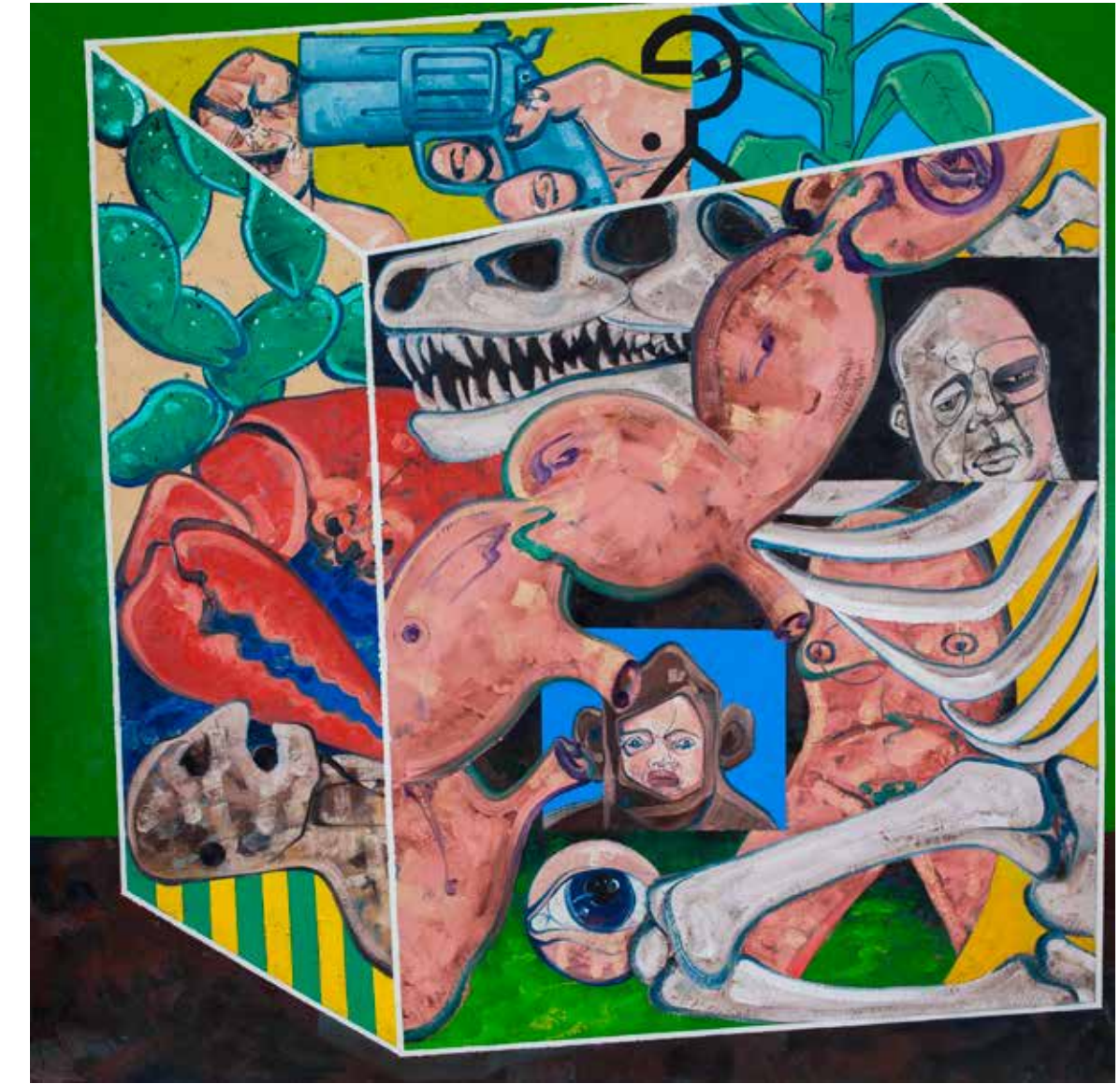
Isimsiz | Untitled 2017 Tuval üzerine yağlıboya | Oil on canvas 200 x 200 cm