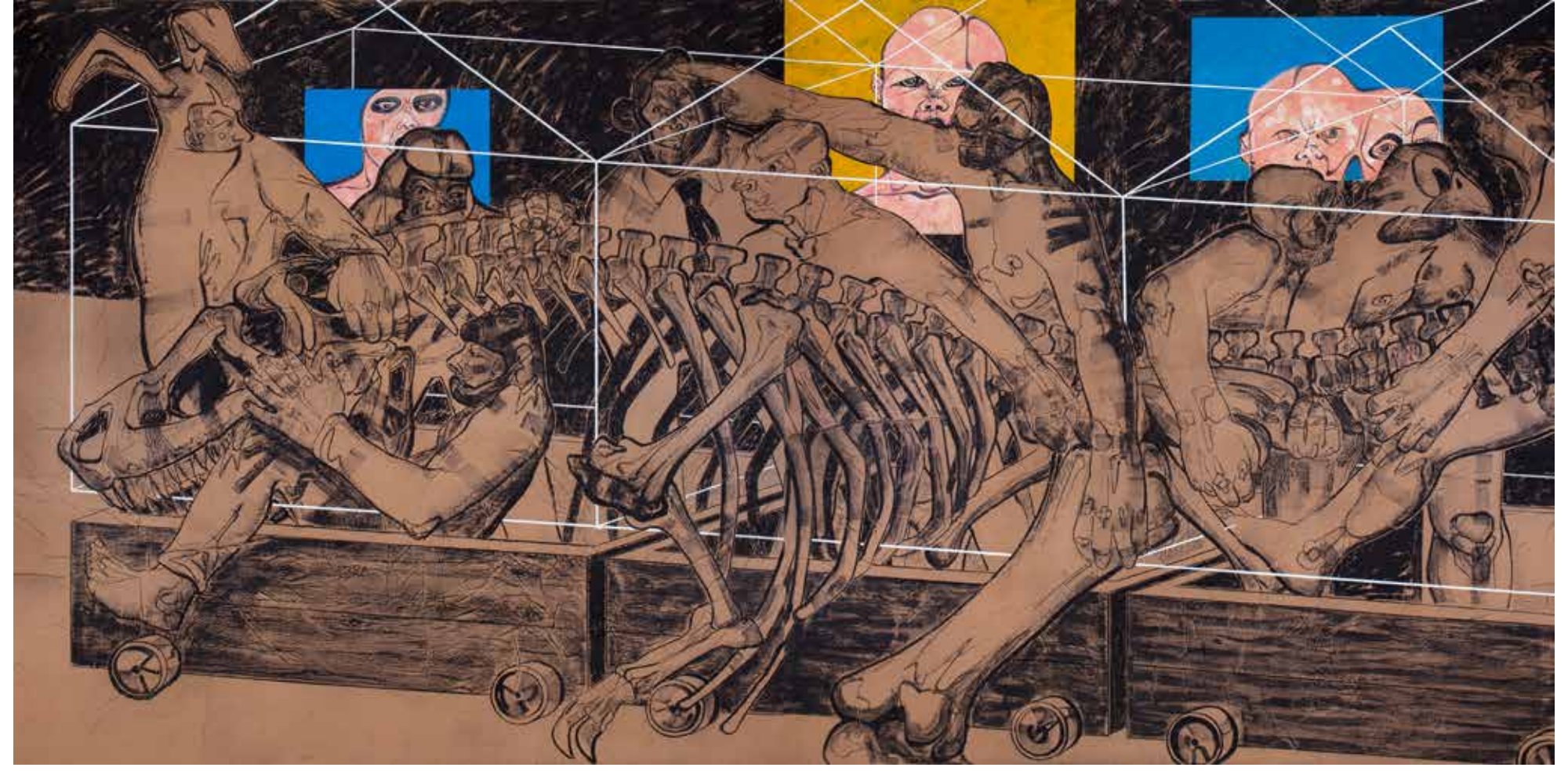
Deliler Treni II | Madness Train II, 2017

Sungur'un kendine has sert ve keskin renkleri, yoğun boya dokusu ve grafik elementleri ile kurduğu katmanlı ve kalabalık kompozisyonları, sanatçının, insan doğasını, evrimi, varoluşu ve iktidar ilişkileri bağlamında ele aldığı kadın-erkek, sivil-politik, ölüm-yaşam, doğa-insan gibi karşıtlıkları sorguladığı etkileyici bir alan oluşturur. Bu sergide yer alan çalışmalar ise ele alınan meselelerin içinde barındırdığı olumsuzluk ve dramatik havaya tezat oluşturacak biçimde kullanılan renklerin canlılığı ve armonisi ile neşeli ve umut verici bir yörünge yaratır.