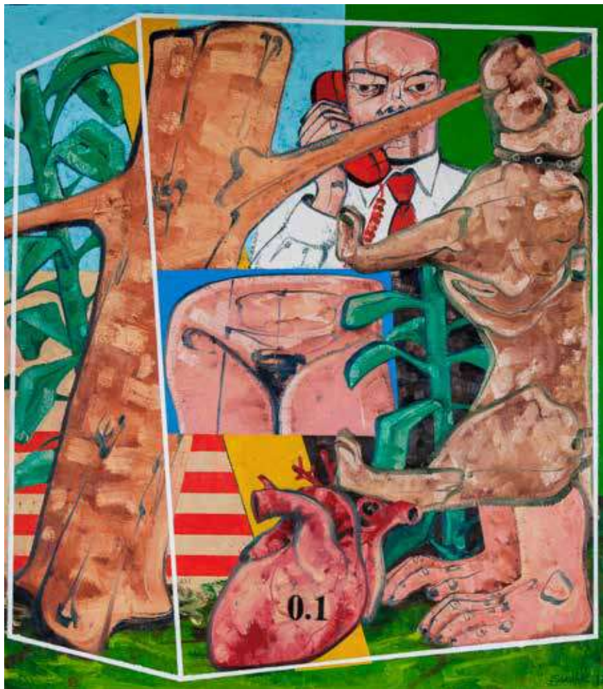
Isimsiz | Untitled 2017 Tuval üzerine yağlıboya | Oil on canvas 160 x 140 cm