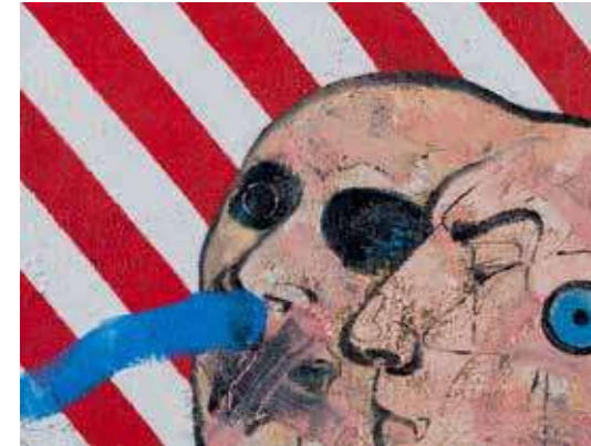
Isimsiz | Untitled 2017 Tuval üzerine yağlıboya | Oil on canvas 30 x 40 cm