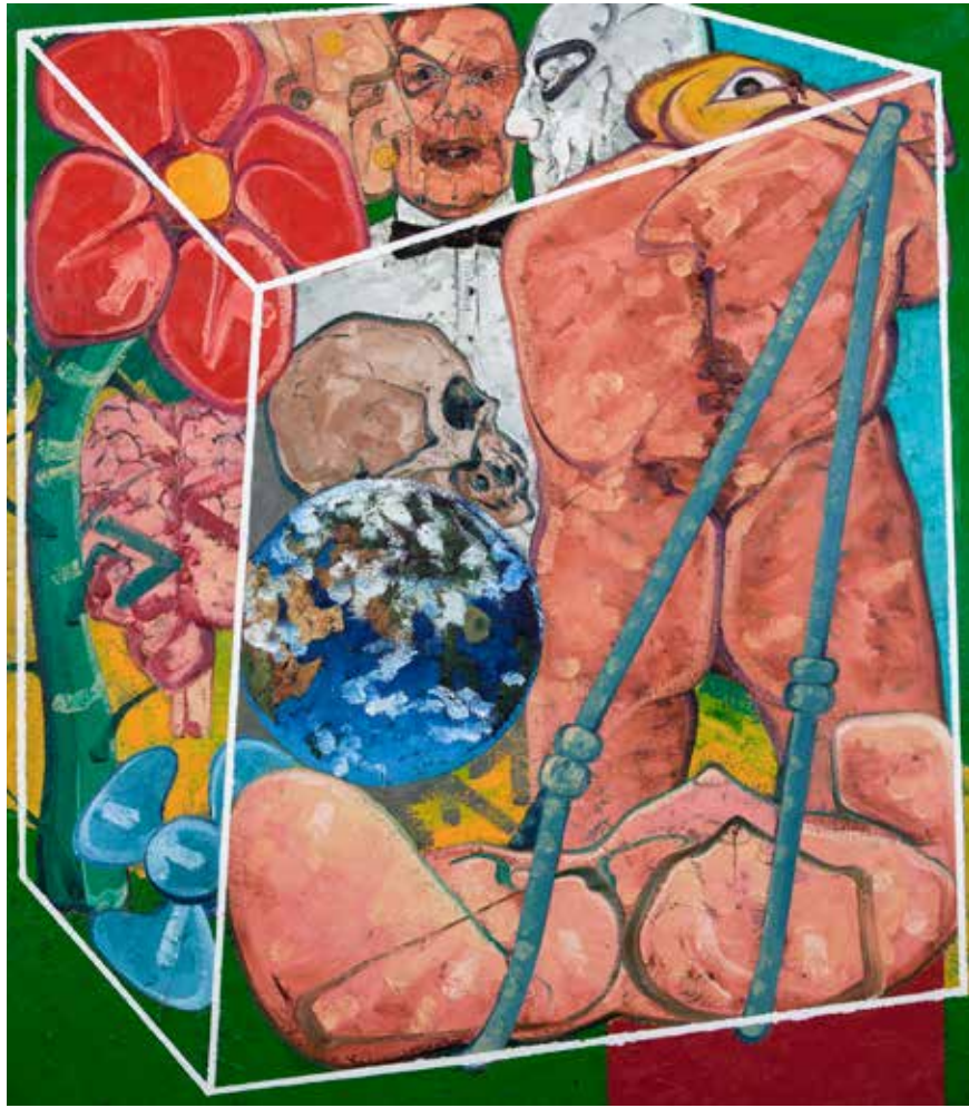
Isimsiz | Untitled 2017 Tuval üzerine yağlıboya | Oil on canvas 160 x 140 cm