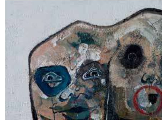
İsimsiz | Untitled 2017

Tuval üzerine yağlıboya | Oil on canvas 30 x 40 cm