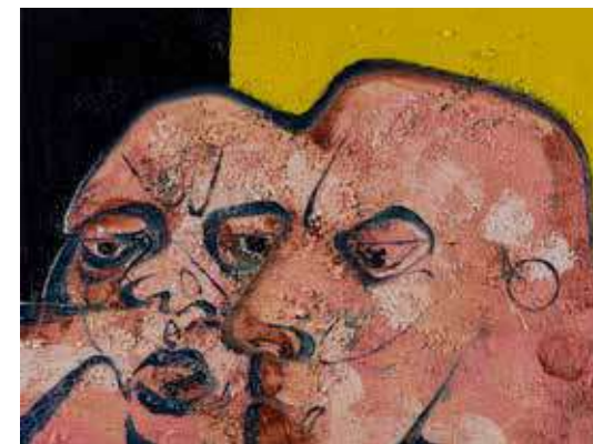
Isimsiz | Untitled 2017 Tuval üzerine yağlıboya | Oil on canvas 30 x 40 cm