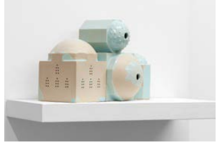
From Far Away, 2015 Beyaz toprak, sır White clay, glaze 24 x 28 x 24 cm

Küçük işlerde form arayışları daha kolay oluyor. Büyük işlere geçmeden küçük boyutlarda forma yaklaşmak, bir şekilde ona hâkim olmak veya olmaya çalışmak daha mümkün. Ayrıca büyük işlerimdeki gibi uzun soluklu olmamaları da hoşuma gidiyor. Son zamanlarda küçük ama derin, insanı içine çeken, işi algımlarken içinde pek çok katman keşfedilebilen işleri sever, önemser oldum.