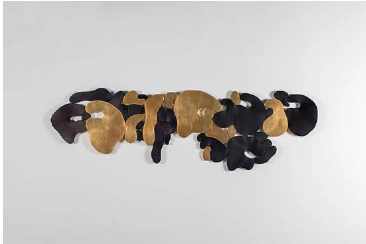
Mithat Şen, III. İstif Serisinden 1, Şasiye gerilmiş tuval üzerine varak ve boyanmış keçi derisi, 86x262 cm, 2017